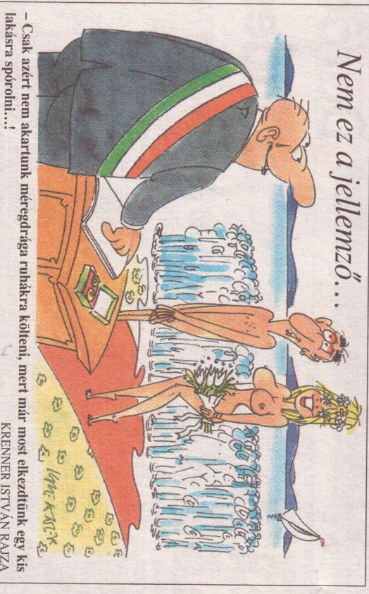
Nem ez a jellemző...

- Csak azért nem akartunk mérgejtágra ruhákra költeni, mert már most elkezdünk egy kis lakásra spórolni...!